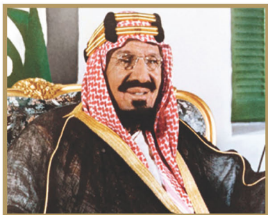
Le Roi Abdelaziz bin Abderrahmane Al-Saoud – Que Dieu bénisse Son âme

Les dirigeants de ce pays se sont engagés a l'approche islamique de la Choura depuis la fondation du premier État Saoudien de l'année 1158 a nos jours. L'approche islamique de la Choura n'est été cessé dans ce pays depuis sa fondation et a travers ses trois époques.