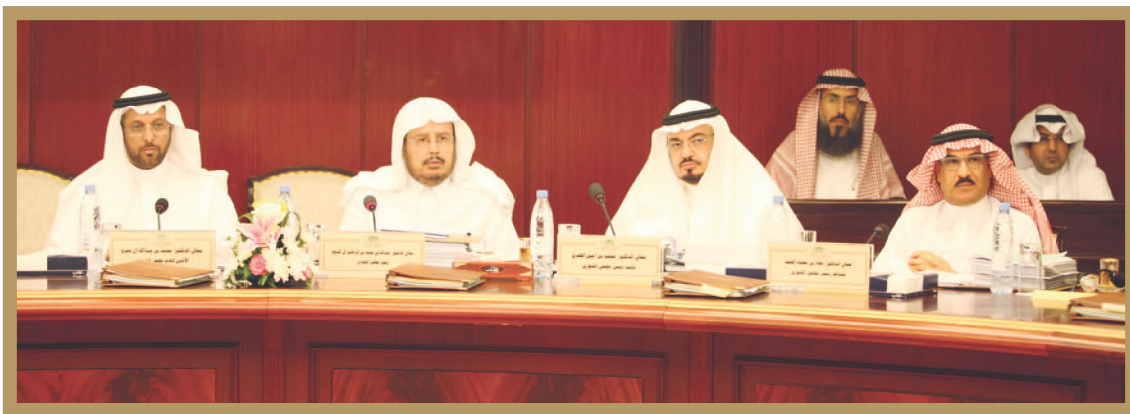
le président du Conseil de la Choura a été présidé l'un des réunion du Comite General

Si les deux sont absents, le président-adjoint préside le conseil, ainsi que les réunions du comité général.