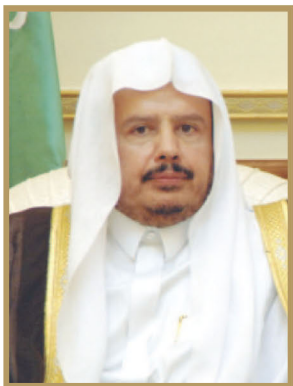
The council Speaker office H. E Speaker of the Shura Council Dr. Abdullah bin Mohammad Bin Ibrahim Al-Sheikh

Le Président du Conseil supervise toutes les activités du Conseil ,le représente dans ses rapports avec les autres instances et organismes et parle en son nom, et préside toutes les séances du Conseil et les réunions du Comité Général ,ainsi que celles des commissions auxquelles il assiste.