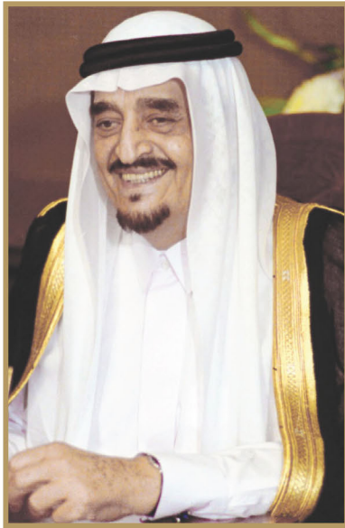
Le Roi Fahd bin Abdelaziz Al-Saoud - Que Dieu bénisse Son âme

Le Conseil de la Choura est été établi en Arabie Saoudite au début de la quatrième décennie du 14 H, l'établissement du Conseil a témoigné des plusieurs étapes depuis 1343-1925.