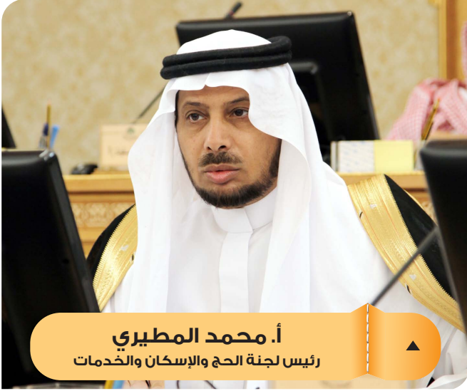
أ. محمد المطيري رئيس لجنة الحج والإسكان والخدمات