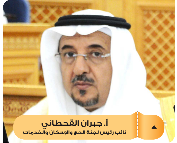
أ. جبران القحطاني نائب رئيس لجنة الحج والإسكان والخدمات