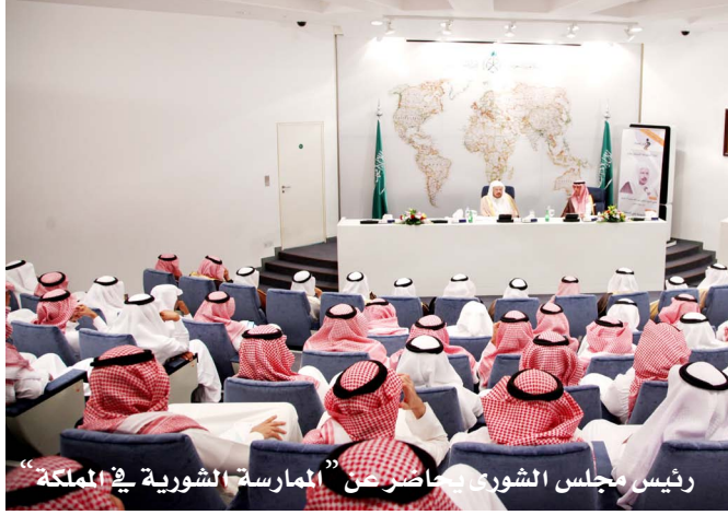
رئيس مجلس الشورى يحاضر عن "الممارسة الشورية في المملكة"

الرشيدة تطويراً وتعزيزاً لدوره في الشأن الخارجي وتفعيل الدبلوماسية البرلمانية التي حققت نجاحات كبيرة في إيجاد قنوات من التواصل الفاعل مع البرلمانات والمجالس المماثلة في الدول الشقيقة والصديقة؛ وتعزيز المواقف وتوحيدها في سبيل خدمة قضايا الأمتين العربية والإسلامية، مضيفاً "أن مجلس الشورى في شراكة دائمة مع وزارة الخارجية، ويرحب بأي مقترح من الوزارة يساهم في تطوير الدبلوماسية البرلمانية للمجلس، في إطار سعيه لتوحيد الرؤى والجهود في العمل الخارجي والدبلوماسي تحقيقاً لما تصبوا إليه هذه البلاد من خير وأمن وسلم للعالم كله".