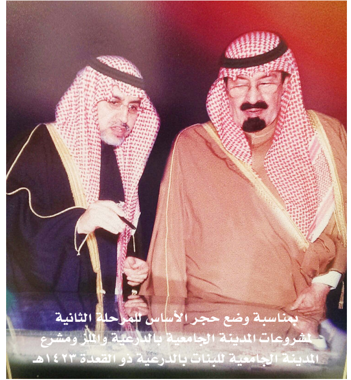
بمناسبة وضع حجر الأساس للمرحلة الثانية لشروعات المدينة الجامعية بالدرعية والمثلث ومشروع المدينة الجامعية للبنات بالدرعية ذو القعدة ١٤٢٣هـ