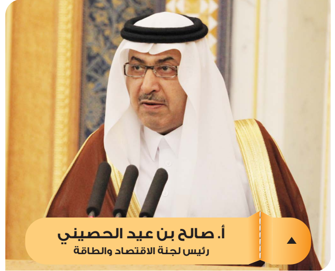
أ. صالح بن عيد الحصيبي رئيس لجنة الاقتصاد والطاقة