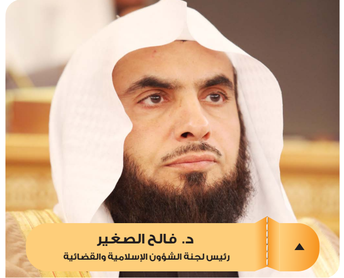
د. فالخ الصغير رئيس لجنة الشؤون الإسلامية والقضائية

المملكة العربية السعودية هيئة التحقيق والادعاء العام THE BUREAU OF INVESTIGATION AND PUBLIC PROSECUTION