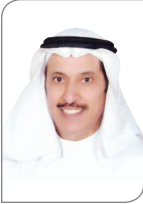
د. عبد الله بن إبراهيم العسكر عضو مجلس الشورى

السياسة politique في القاموس الغربي الحديث هي: فن ممارسة القيادة وكل ما يتعلق بإدارة الدولة أو السلطة، بينما يرد في معجم المصطلحات الفلسفية تعريفات عديدة لهذا العلم، بعضها يتوسع بهذا العلم لدرجة أن يجعله مسيطراً على كل العلوم. وأخيراً استقر الأمر على تعريف العلوم السياسية حسب الفروع لهذا العلم المتشعب. هذا العلم الجديد القديم له بدايات وارهصات قديمة وليس بداية واحدة. ولتداخل علوم عديدة مع علم السياسة تحول اسمه في العصر الحديث على يد الأمريكيين من علم السياسة إلى العلوم السياسية. وفي علم السياسة ينطبق المثل العربي القديم: كل يغني على ليلاه، لما يراه بعض المختصين أنه علم متعدد المشارب، ومتنوع المصادر والموارد؛ فمن يراه يوناني النشأة وتحديداً على يد أرسطو، خصوصاً بعد تأليفه كتاب: السياسة، حتى أن كلمة سياسة politique مشتقة من الكلمة الإغريقية polis.