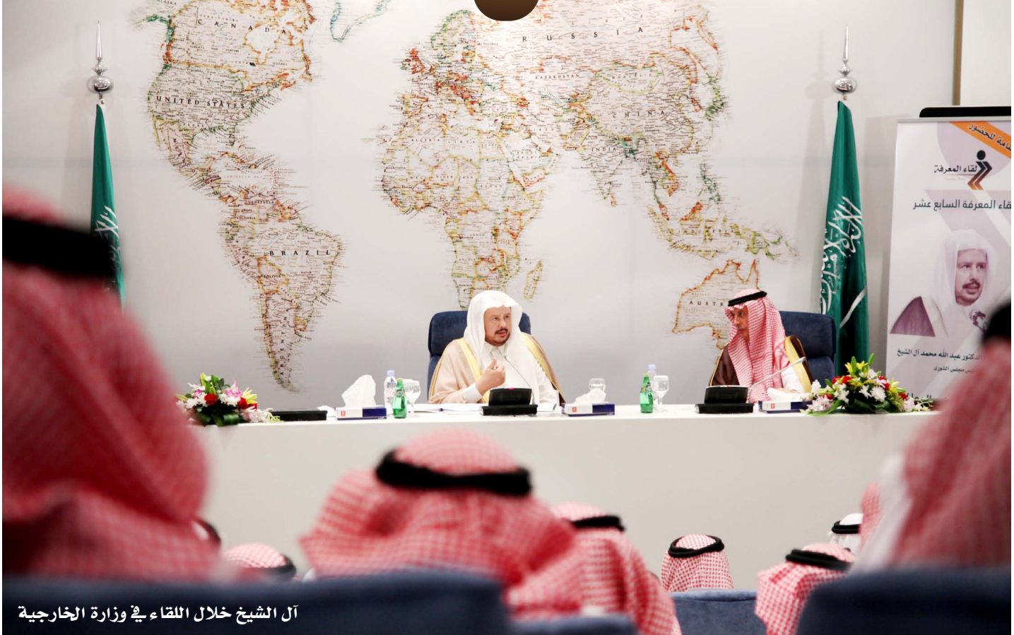
آل الشيخ خلال اللقاء في وزارة الخارجية